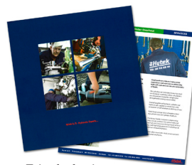
Tekstforfatning og oversættelse